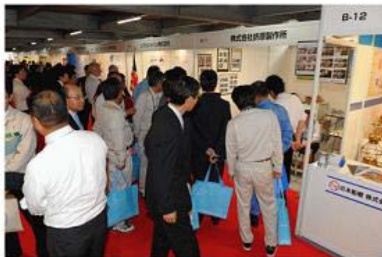
今治海事展 会場初日の様子

日本最大の海事都市、今治へ。 SEA JAPANを展開するCMPが、西日本発の海事展を開催!