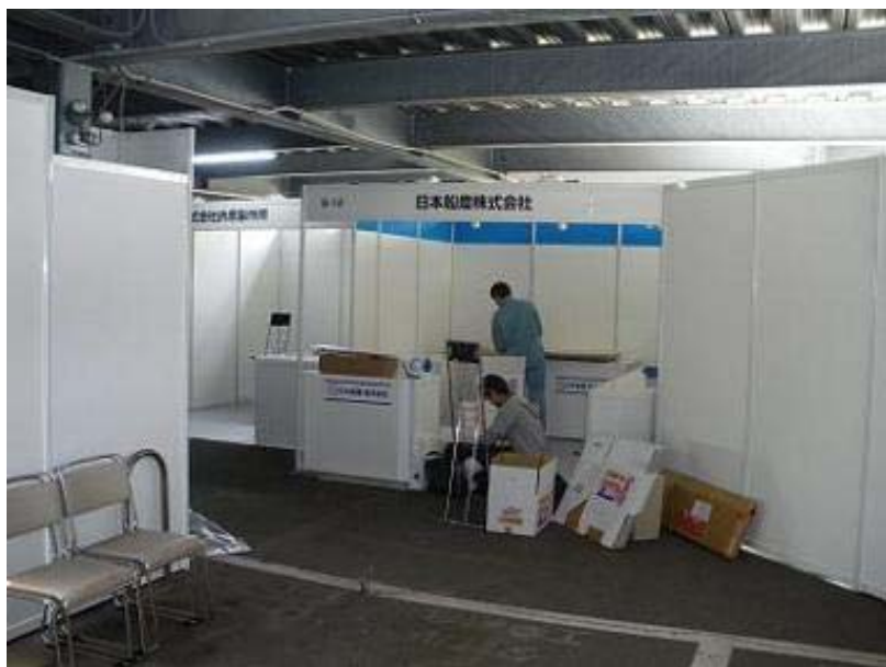
会場へ到着。パッケージブースが既に立ち上がっています。