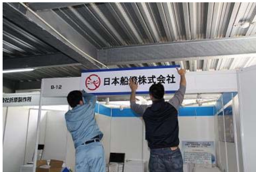
社名看板をオリジナルに変えます。また壁面にブルーラインを貼っていきます。